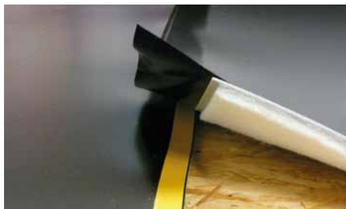
Geïntegreerde zelfklevende zijflap om een eenvoudige plaatsing en een perfecte luchtdichtheid te verzekeren

Bijkomend kan u opmerken dat de InsulWood aan de bovenzijde uitgerust is met een gladde HD-PE folie. Deze is niet enkel zeer sterk, maar laat tevens de gemakkelijke, glijdende plaatsing van de houten panelen aan de bovenzijde toe. De eerder aangehaalde geringe dikte, laat u tevens toe om met het product tegen de muur naar boven te komen, waardoor elk contact of akoestische lek van de vloer naar de muur vermeden wordt.