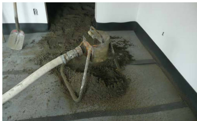
Versterkte chape gieten met een dikte van \pm 8 cm op insulit Bi+20