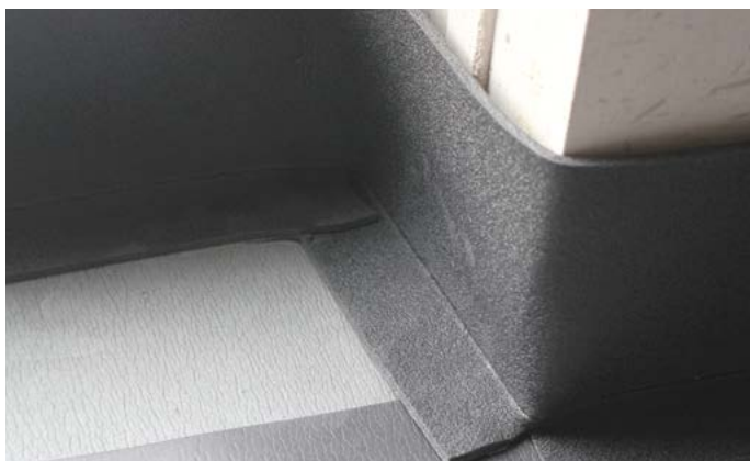
Verbinding tussen de muur en de insulit Bi+20 verwezenlijken met Lfoam 18 randstrook