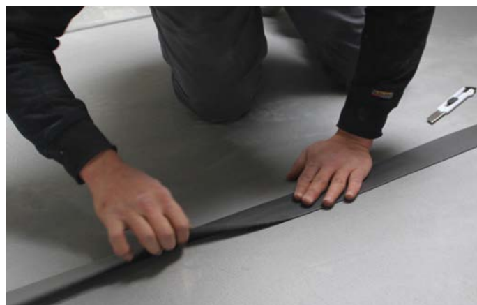
Thermisch afdichten met de meegeleverde Stickelfoam 25/70